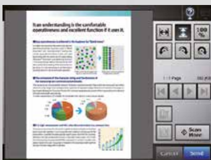
Écran visionneur de Scan