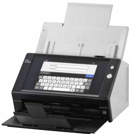
A4 Portrait à 300 dpi 25 ppm / 50 ipm Scannez lots mixtes jusqu'à 50 feuilles