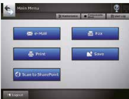
Écran du menu principal