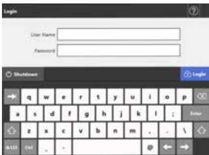
Écran d'ouverture de session

Lors de l'initialisation du scanner N7100, des données complètement aléatoires et sans intérêt peuvent être écrasées dans les parties libres de la mémoire interne et, pour une sécurité accrue, une nouvelle clé d'encryptage est générée après la suppression des informations de l'utilisateur. De la sorte, les anciennes données de l'utilisateur ne laissent aucune trace dans la mémoire disponible.