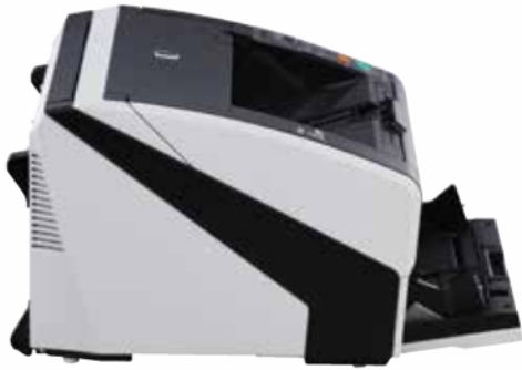
fi-7800 – A4 Paysage à 300 dpi 110 ppm / 220 ipm fi-7900 – A4 Paysage à 300 dpi 140 ppm / 280 ipm Scannez lots mixtes jusqu'à 500 feuilles