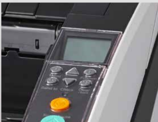
Écran à cristaux liquides intégré dans le panneau de commande

Les scanners fi-7800 et fi-7900 de Fujitsu constituent une solution de numérisation complète. La combinaison de nos scanners, de nos logiciels et d'un service client qui compte parmi les meilleurs sur le marché vous fournit tout ce dont vous avez besoin pour améliorer la productivité de vos processus et libérer ainsi du temps pour vos collaborateurs. Vous pourrez ainsi mieux vous concentrer sur votre cœur de métier plutôt que sur la technologie.